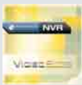
VideoEdge NVR 4.0