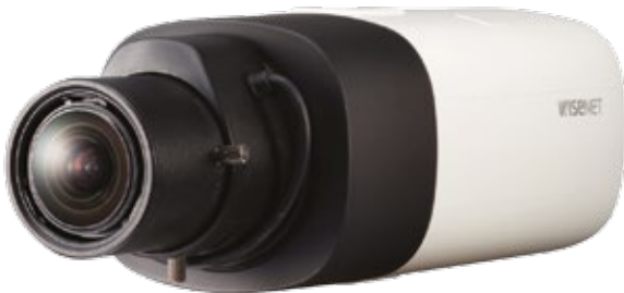
* El objetivo no está incluido